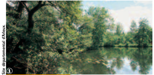
Site départemental d'Arleux.

Une sélection des 30 plus belles balades