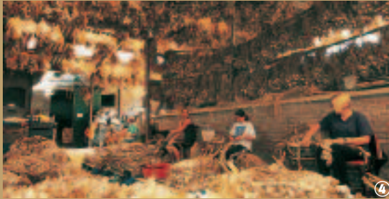
Arleux, Foire à l'ail.

la main. Mais la saveur unique s'obtient lors du séchage : contrairement à la culture de l'ail dans le midi, l'ail d'Arleux n'est pas séché au soleil. Il est placé dans un fumoir où une lente combustion de sciure, paille et tourbe, lui procure un arôme subtil et une coloration rousse exceptionnelle. Cette opération de fumage est répétée une dizaine de jours après chaque récolte.