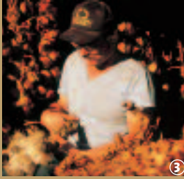
Arleux, Foire à l'ail.

La culture de cette plante résulte d'un savoir-faire ancestral ; les différentes étapes : égoussage, plantation, arrachage, tressage, se font à