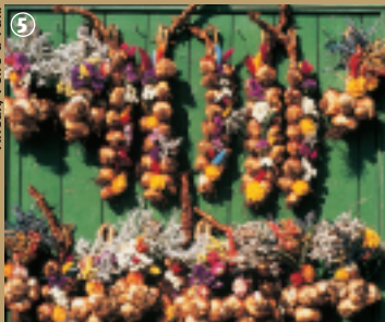
Arleux, Foire à l'ail.

Porter les 2 litres d'eau salée à ébullition. Eplucher l'ail ainsi que les légumes, en prenant soin de supprimer les germes de chaque gousses d'ail. Mettre les légumes dans l'eau à ébullition et laisser cuire à petit feu 2 bonnes heures. Au bout de ce temps, mixer la soupe. La verser dans la soupière et ajouter la crème fraîche. Servir immédiatement accompagné de pain grillé.