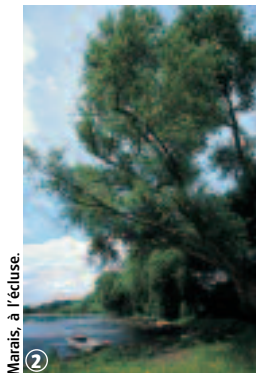
Marais, à l'écluse.

En période de chasse, l'accès peut être réglementé : se renseigner en mairie sur les calendriers de chasse. Meilleure période : d'avril à octobre.